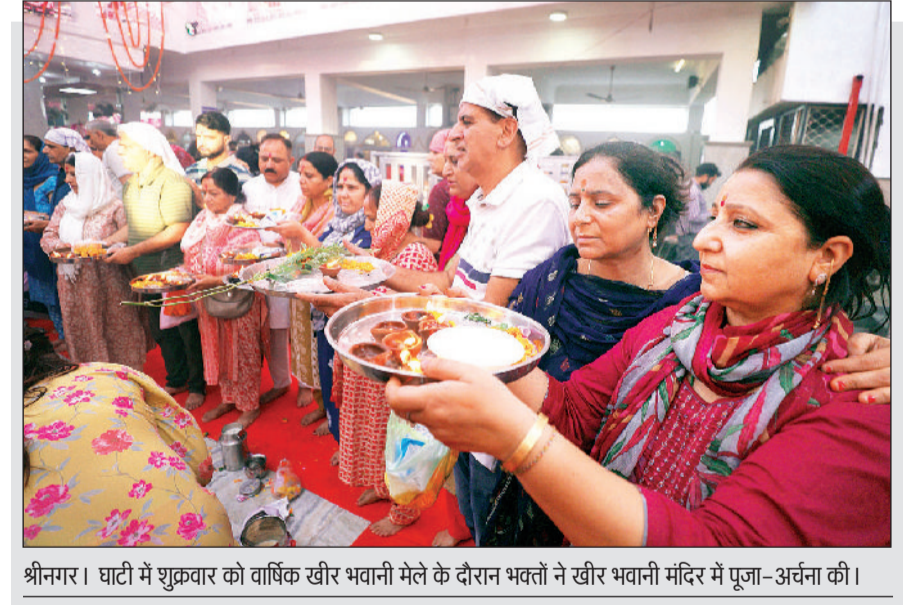
श्रीनगर। घाटी में शुक्रवार को वार्षिक खीर भवानी मेले के दौरान भक्तों ने खीर भवानी मंदिर में पूजा-अर्चना की।