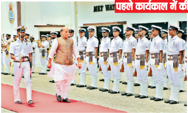
पहले कार्यकाल में की थी सियाचिन की पहली यात्रा

उन्होंने कहा कि हिमालय से आईओआर तक हमारी प्राथमिकता देश की सीमाओं की सुरक्षा को मजबूती प्रदान करना है। इससे देश का उत्तरी और दक्षिण भाग एक सूत्र में बंधेगा। प्रधानमंत्री नरेंद्र मोदी के सागर (सियाचिन) एंड ग्लोबल ऑल इन्ड (दूरीजन) विजन पर भारत की यह समूची कवायद जारी है। इसकी वजह से क्षेत्र में भारत के मित्र देश सुरक्षित हैं और आपसी प्रगति की राह पर आगे बढ़ रहे हैं। 2019 में रक्षा मंत्री के रूप में अपने पहले कार्यकाल की शुरुआत राजनाथ सिंह ने सियाचिन क्लेश की यात्रा से की थी।