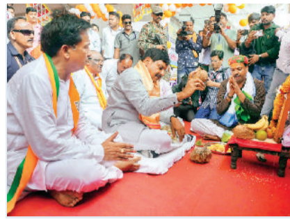
प्रदेश में 5 करोड़ 50 लाख पौधे लगाने का अभियान

यादव ने कहा कि स्थानीय युवाओं को जिले में ही रोजगार उपलब्ध कराने के उद्देश्य से बैतूल जिले में उद्योग लगाने की योजना है। मुख्यमंत्री ने कहा कि प्रदेश में तीर्थ यात्रा के लिए हेलीकॉप्टर सेवा शुरू की जा रही है। शुरूआत में दो ज्योतिर्लिंगों, ओंकारेश्वर और महाकालेश्वर को इस सेवा से जोड़ा जा रहा है। प्रदेश के युवा हेलीकॉप्टर और विमान चलाना सीखें, इस उद्देश्य से आवश्यक प्रशिक्षण व कोर्स शुरू किए जा रहे हैं, इसके तहत जिलों में उपलब्ध हवाई पट्टियों का उपयोग युवाओं को पायलट के रूप में प्रशिक्षित करने के लिए किया जाएगा।